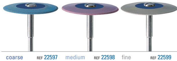
coarse REF 22597 medium REF 22598 fine REF 22599