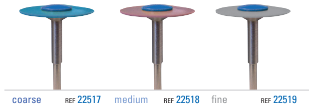
coarse REF 22517 medium REF 22518 fine REF 22519