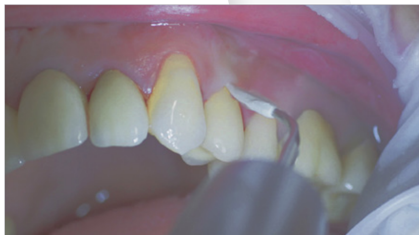
Abb. 7 Tigon + mit 1l

So sinkt das Risiko für eine Periimplantitis schon bei einer jährlichen sorgfältig durchgeführten Recallsitzung von 43,9 Prozent (kein Recall) auf 18 Prozent, also um mehr als die Hälfte (28). Für diesen Zweck sind Ultraschallsysteme mit speziellen materialschonenden Instrumenten geeignet, zum Beispiel aus PEEK (Abb. 7) oder entsprechende Handinstrumente (29).