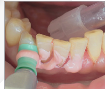
Abb. 6 Proxeo mit Polierkelch

Implantate und Suprastrukturen werden routinemäßig zum Beispiel mit Ultraschallgeräten und speziellen Kunststoffinstrumenten gereinigt.