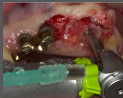
Abb. 4 Implantmed und WS-56

Alternativ lässt sich das Implantatlager mit piezochirurgischen Systemen präparieren, für die spezielle Instrumentensätze zur Verfügung stehen (18). Mit anderen Spezialinstrumenten kann schonend und zugleich sehr effektiv Knochen bearbeitet werden. Indikationen sind zum Beispiel Kieferkammsspaltung, chirurgische Zahnentfernung und die Präparation von Knochenblöcken oder lateralen Fenstern für Augmentationen (19). Hoch entwickelte piezochirurgische Geräte sind zugleich minimalinvasiv gegenüber Weichgewebe.