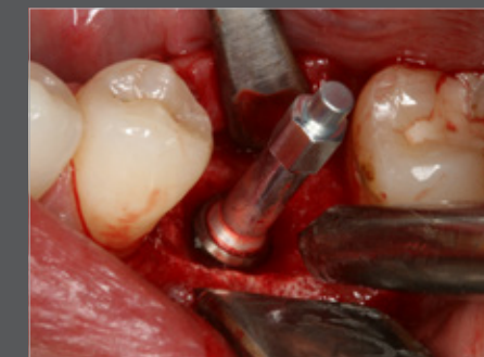
Abb. 5 Oststell ISQ Modul

Mit der Resonanzfrequenzanalyse lässt sich feststellen, ob das Implantat bereits prothetisch belastbar ist.