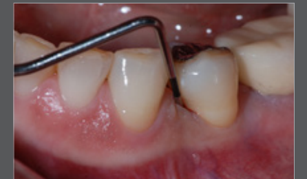
Abb. 1 WHO Sonde Ein regelmäßiges parodontales Screening gehört zur Basisdiagnostik, besonders wenn eine Implantation geplant ist.