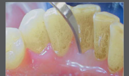
Abb. 2 Tigon+ mit 3U Zahnsteinentfernung mit Ultraschall ist wesentlicher Teil der professionellen Zahnreinigung.