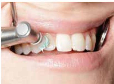
Fluoridierung mit Bifluorid 10 nach einer professionellen Zahnreinigung

Mit Bifluorid 10 haben Sie das ideale Präparat in der Hand, um diese Beschwerden effektiv zu lindern. Darüber hinaus eignet sich Bifluorid 10 ideal für die beschleunigte Remineralisierung und Fluoridierung der Zahnhartsubstanz. Auch beugt Bifluorid 10 nach dem Legen von Füllungen, insbesondere nach Anwendung der Ätztechnik, der möglichen Ausbildung einer Sekundärkaries vor.